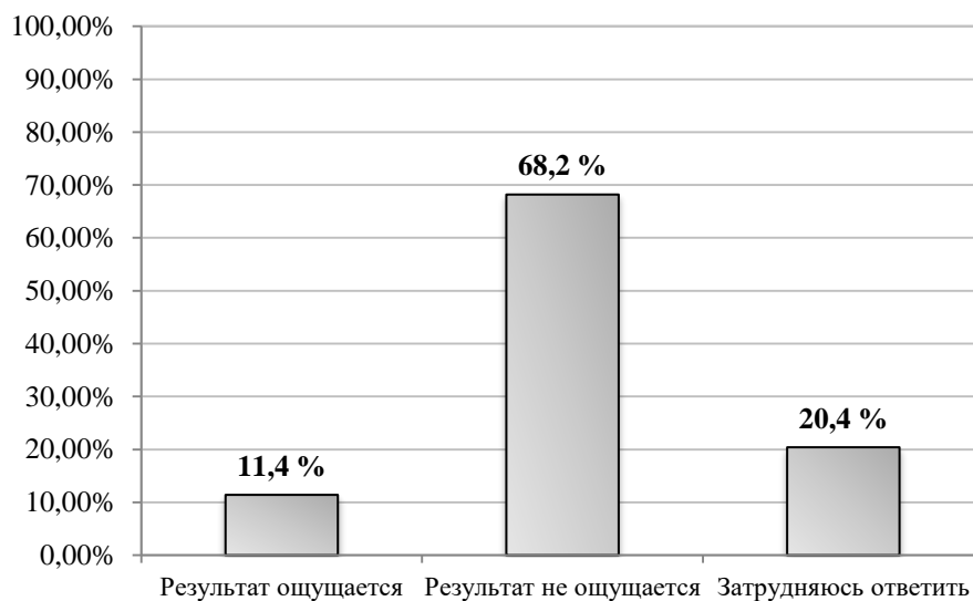
Рис. 2. Результат проводимой федеральными и региональными органами власти политики дебюрократизации образовательных организаций 2

Значительная часть респондентов – 68,2 % (221 чел.) – считает, что результат не ощущается и «бумажной» работы стало больше, при этом не могут оценить степень результативности проводимых мероприятий (затрудняются ответить) еще 20,4 % опрошенных (66 чел.). Лишь малая доля респондентов – 11,4 % (37 чел.) – считает, что проводимая органами власти политика дебюрократизации позволила освободить достаточное количество рабочего времени для уделения его непосредственно образовательному процессу (см. рис. 2).