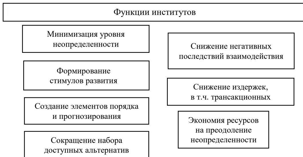
Рис. 1. Функции институтов 1

Как уже отмечалось, институты существуют в тесной взаимосвязи и влияют на развитие экономики и всего общества в целом. Все отношения в экономике в современном мире регулируются посредством большого объема всевозможных норм и правил, контрактов, что свидетельствует о значимости исследований институциональной среды.