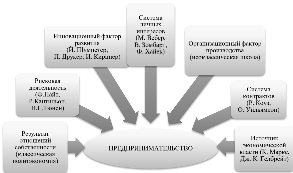
Рис. 1. Научные теории предпринимательства 1

Предпринимательство рассматривается как особый вид деятельности многими авторами. В соответствии с этим в экономической науке существует многообразие подходов и теорий к его определению. Научные теории, несмотря на свое различие, описывают различные стороны предпринимательства (например, цели, направления, желаемые результаты, сфера), чем способствуют формированию полноценного понимания сущности этого понятия. На рис. 1 представлены примеры теорий предпринимательства в научной литературе.