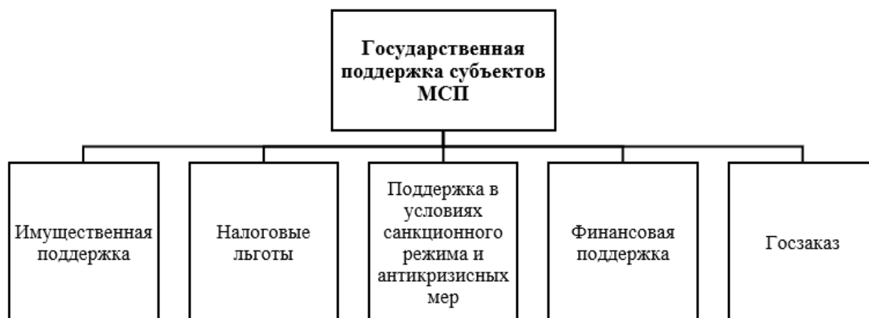
Рис. 3. Система государственной поддержки субъектов МСП 1