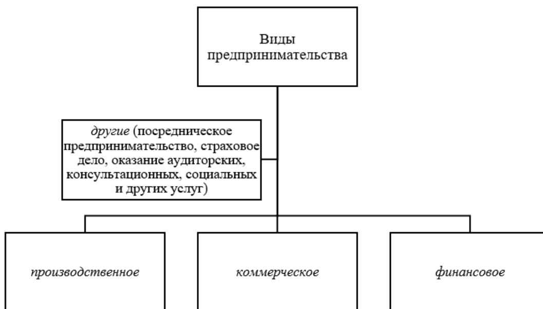
Рис. 2. Виды предпринимательской деятельности 1 Fig. 2. Types of entrepreneurial activity

Предпринимательство как особый вид экономической активности является категорией бизнеса. Отнесение хозяйствующих субъектов к субъектам малого и среднего предпринимательства осуществляется в соответствии с критериями, установленными согласно ст. 4 ФЗ от 24.07.2007 № 209-ФЗ «О развитии малого и среднего предпринимательства в Российской Федерации» 2 , и представлено в табл. 2.